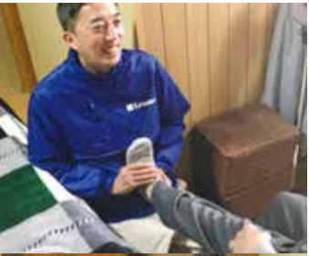
国家資格を持つ施術師が訪問

「ご存知ですか？便利な『在宅マッサージ』のこと。寝たきりや歩行困難（要介助）な方などを対象に、国家資格を持つ施術師が自宅や利用している介護施設等まで来てくれて、マッサージや鍼灸をしてくれるんです。