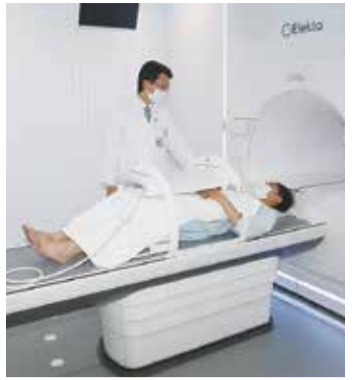
東北大学病院に導入された「MRリニアックシステム」。