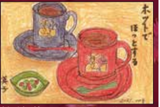
柏崎英子81 若林区若林