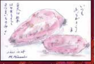
南雅子82 太白区八本松