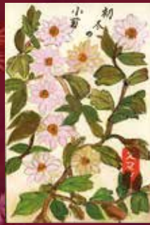
天野ハル90 太白区あすと長町