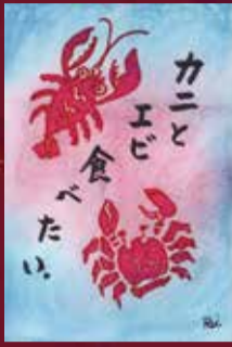
久慈レイ94 太白区大長会リハ