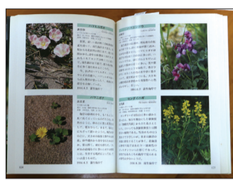
撮りためた写真を一冊に