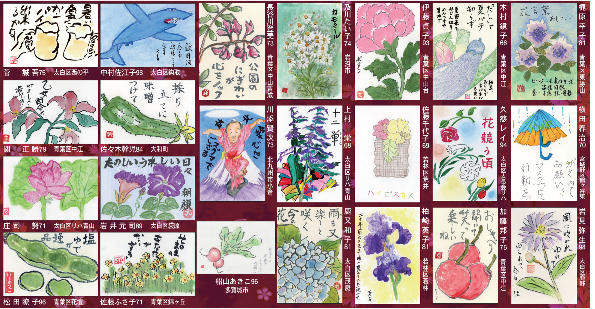
梶原幸子81 青葉区東勝山 横田春治70 宮城野区鶴ヶ谷東 岩見弥生94 太白区鹿野