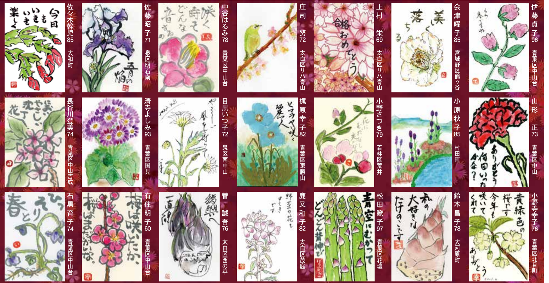
伊藤貞子 96 青葉区中山台 山形 正 73 青葉区中山 小野寺幸子 76 青葉区北目町