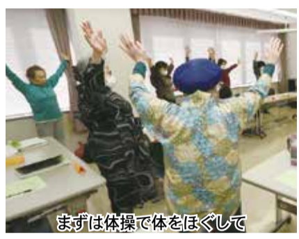
まずは体操で体をほぐして