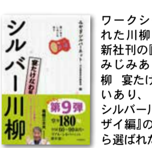
ワークシートに掲載された川柳は、河出新社刊の『笑いあり、しみじみあり、しみじみあり、しみじみあり』の掲載句の中から選ばれたものです。

シルバー川柳には高齢 者の本音であったり、夢 や希望などもユーモアを 交えながら詠まれていま す。年齢が記載されてい ることから情景を思い浮 かべやすいことも手伝わ て、子供たちが高齢者を 理解するために効果的と 判断されたようです。