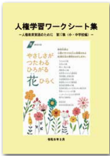
神奈川県教育委員会が発行した『人権学習ワークシート集 第17集(小・中学校編)』

お年寄りのことを子供 柳が大きな役割を果たす 私たちは、どのくらい理解 してくれているのでしょうか？ 核家族化が進んで 高齢者と接する機会が 減っていることもあって 心配になったりもします が、この度、シルバー川