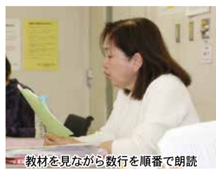
教材を見ながら数行を順番で朗読