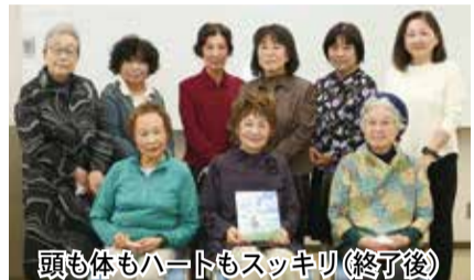
頭も体もハートもスッキリ(終了後)

[シニアのための朗読サロン] ● 仙台市福祉プラザ (第1金曜グループ・第2月曜グループ・第2金曜グループ) ● 旭ヶ丘市民センター (第3水曜グループ) 活動: 14:00 ~ 15:30 ※月1回(年10回) 月会費: 600円(入会金1,000円) 募集: 随時どなたでも(現在の会員は約40人) 問合せ: ☎080-5000-4596 (竹井・朗読サロンぽぷら)