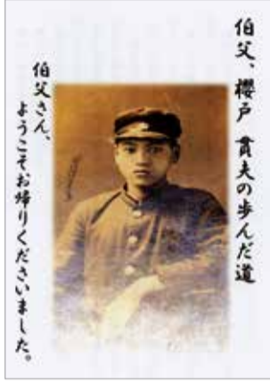
参列者に配布された冊子