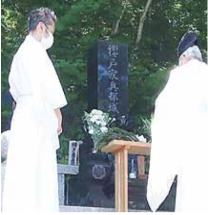
先祖の眠る墓地に埋葬された遺骨