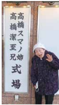
生前葬を2021年に行う

「びっくり肌は秘密は? ツルツル肌の秘密は?」 こんな色はあったかな? こんなところにスミレ、カンシラン、アイリスが。庭の花、一つ一つ見るだけでも楽しい。花さ話しかけて、『暑かろう、暑かろう』とお水をやったり。鳥さんが来たら、『あつ、すずめ、なんだこの頃こねえーな、来たの?』って必ず話しかける。そして鳥つこを絵にかいたり。 友達はたくさんいたのね。みんな歳とって天国に行った。でも、淋しいって感じたことはない。 「全てが楽しくってね。今日はこの花が咲いた。」 と皮膚が弱るから。花や小鳥に話しかけて