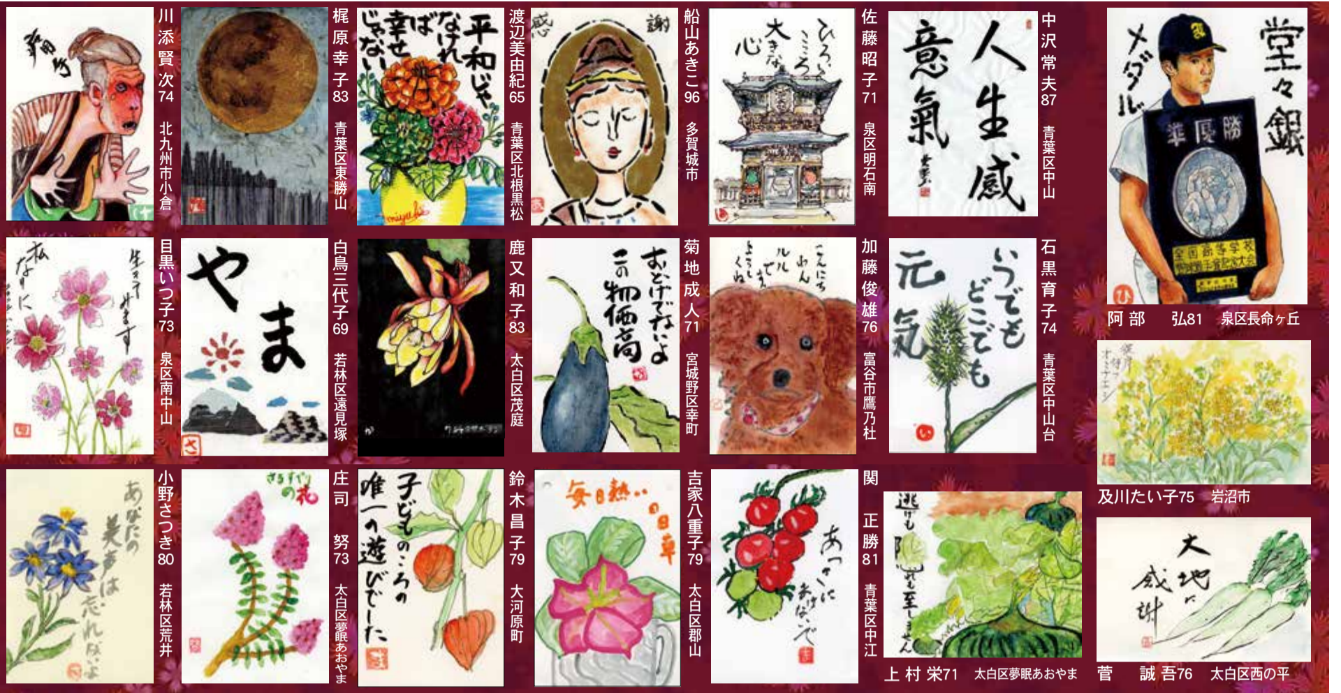
阿部 弘81 泉区長命ヶ丘