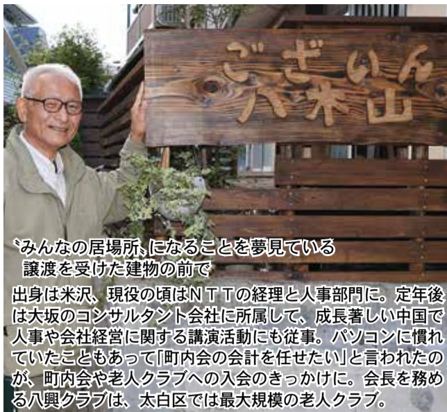
「みんなの居場所、になることを夢見ている 譲渡を受けた建物の前で」

出身は米沢、現役の頃はNTTの経理と人事部門に。定年後は大坂のコンサルティング会社に所属して、成長著しい中国で人事や会社経営に関する講演活動にも従事。パソコンに慣れてきたこととあって「町内会の会計を任せたい」と言われたのが、町内会や老人クラブへの入会のきっかけに。会長を務める八興クラブは、太白区では最大規模の老人クラブ。