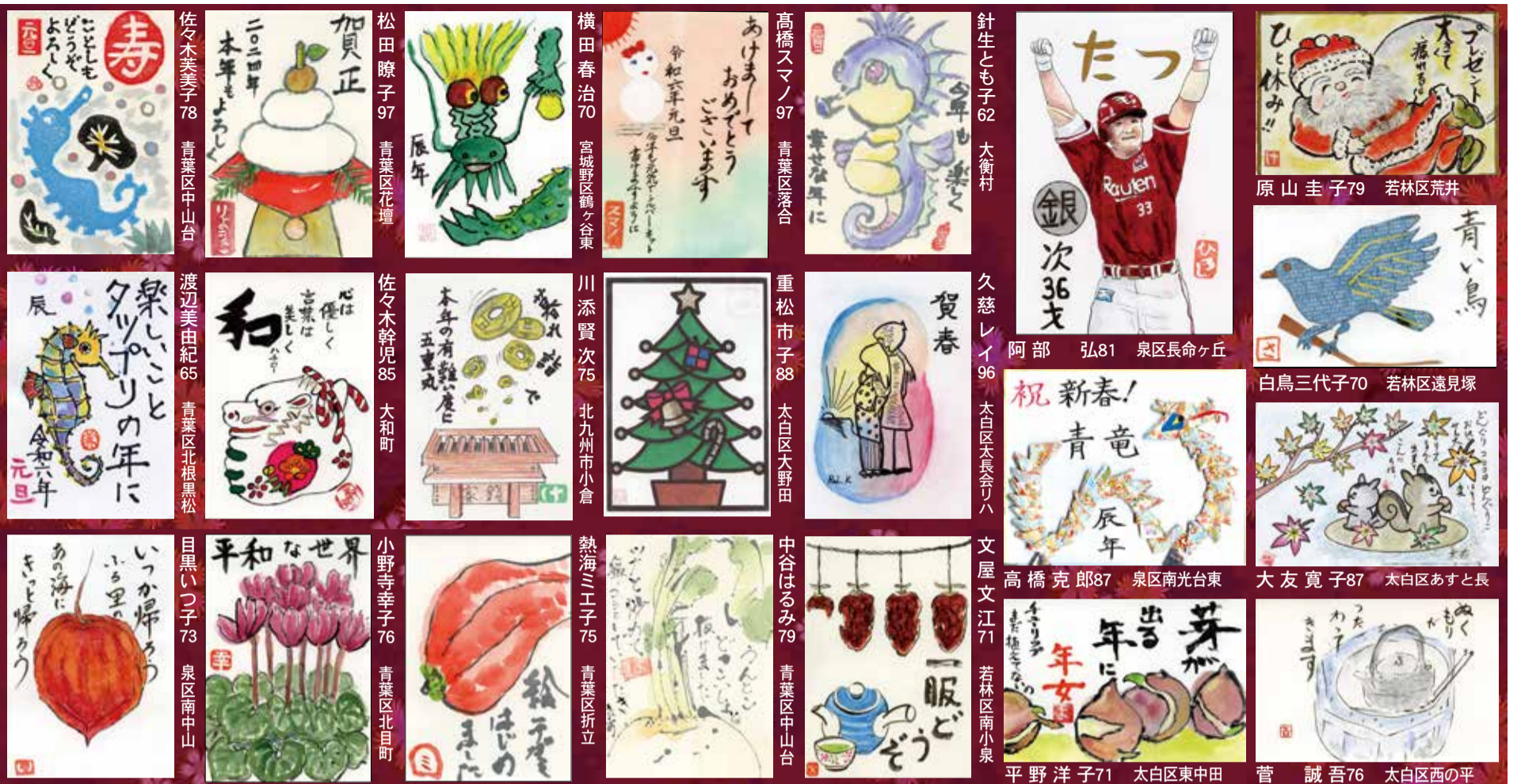
プレゼント 原山圭子79 若林区荒井