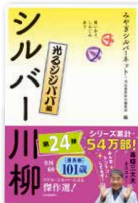
川柳は書籍化され全国で大ヒット中!