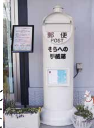
昨年暮れに賢聖院に設置された『そらへの手紙箱』

ポストに投函されていたハガキは、一定数に達したところでお焚き上げされます。※文中で紹介している手紙は「公開OK」に丸がついていたもの。ポストは葛岡霊園のフォレストガーデンにも設置、[バルーン供養祭]は賢聖院でも開催されています。 ●フォレストガーデン ☎ 022-302-6710 ●賢聖院 ☎ 022-722-0238