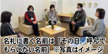
名札に書く名前は「その日、呼んでほしい名前」※写真はイメージ

日常生活で語れなかったことを見知らぬ遺族同士で分かちあう会。最初の90分は、参加者が順番に想いを話します。話すことで、また他人の話に耳を傾けることで、悲しみが和らいだりします。茶話会では、リラックスした雰囲気の中で会話。大切な人を亡くされた方は、どなたでも参加できます。