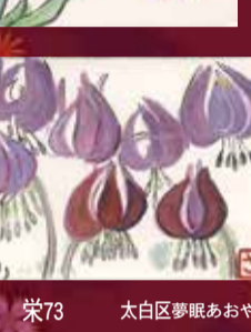
上村 栄73 太白区夢眠あおやま