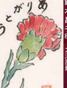
ながり 太白区夢眠あおやま