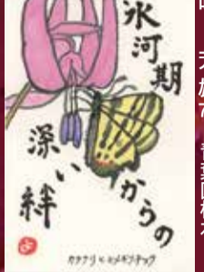
氷河期 青葉区柏木