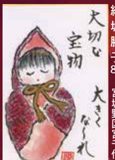
大切な宝物 宮城野区宮千代