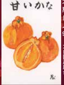
甘いかな 太白区茂庭台