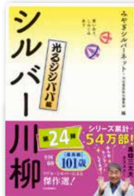
川柳は書籍化され全国で大ヒット中!